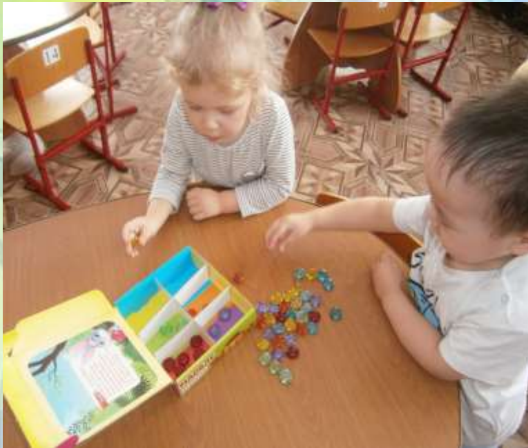
Игра «Разложи по ячейкам»