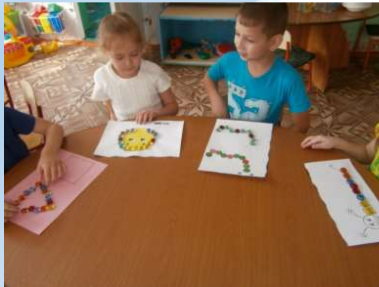
Числовые домики. Состав числа